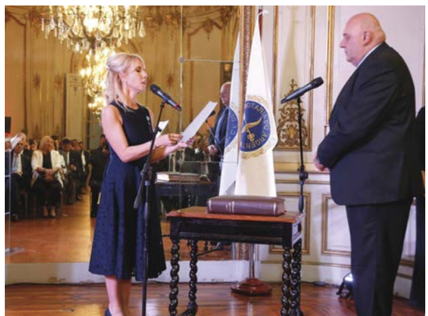
Momentos de la Jura de autoridades