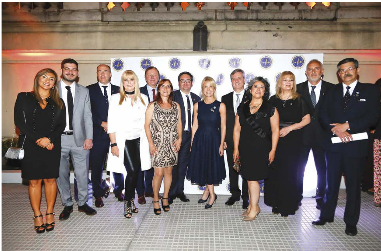
Nueva Junta Ejecutiva del Consejo Federal del Notariado Argentino